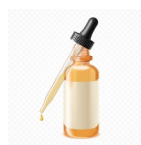
De l'huile essentielle de Palmarosa bio